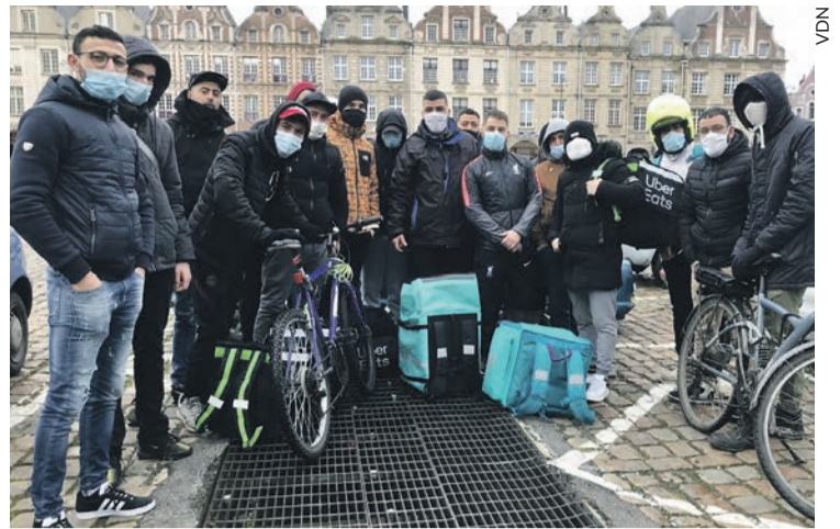
Des livreurs à vélo en grève à Arras en janvier.

fermeture des magasins à 18 heures ont fourni un nouveau marché aux plateformes de livraison. Deliveroo, Uber Eats et C ie ont passé des contrats avec Carrefour, Casino, Picard pour livrer épicerie et surgelés. Plus encore que des profits immédiats, ce que visent ces plateformes de livraison, à l'image d'Amazon, d'ailleurs actionnaire de Deliveroo, c'est d'étouffer leurs réseaux de clients pour écraser leurs concurrents avant d'augmenter massivement leurs commissions. Cela demande des injections de capitaux et c'est l'un des buts de l'introduction en Bourse de Deliveroo.