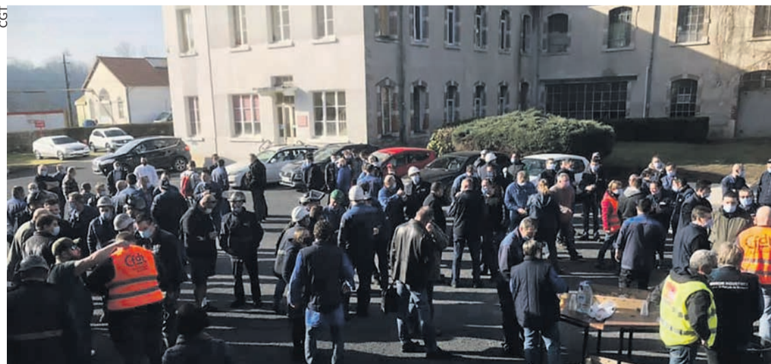
Rassemblement devant les Forges de Bologne le 25 février.