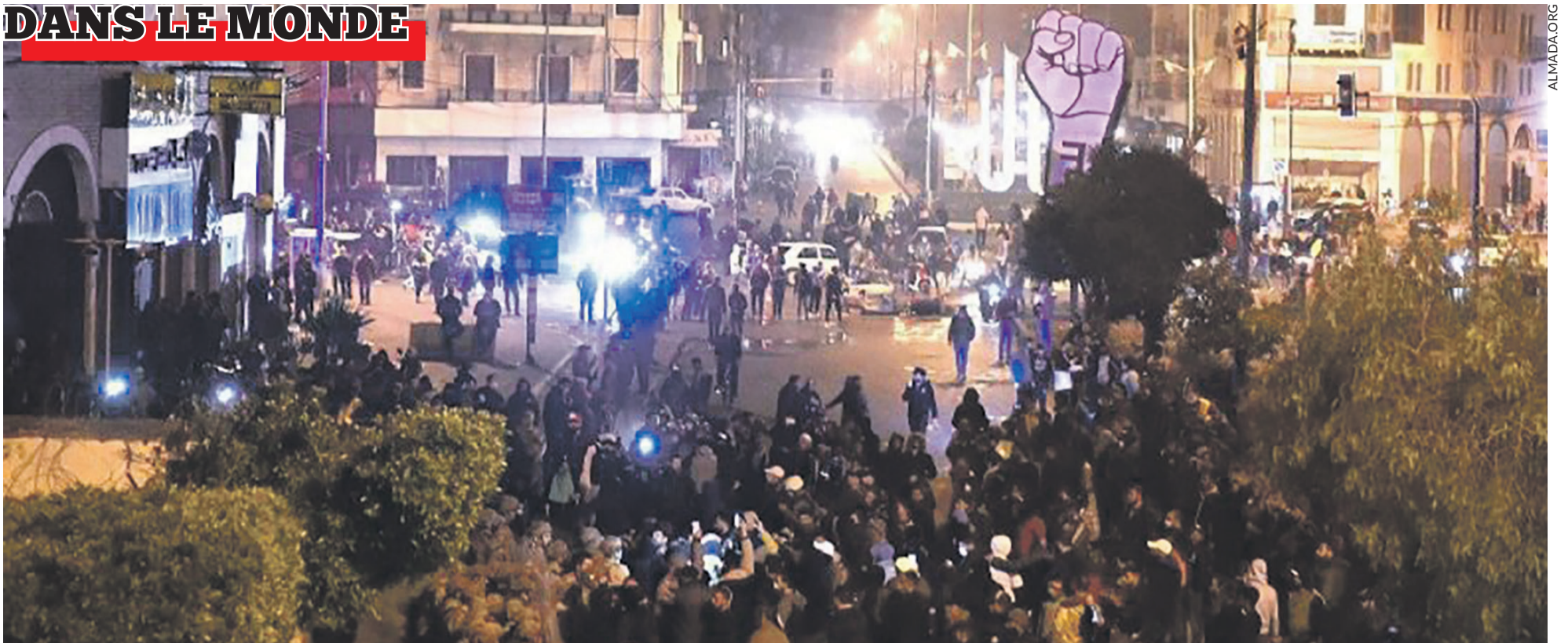
Protestation à Tripoli en janvier 2021.