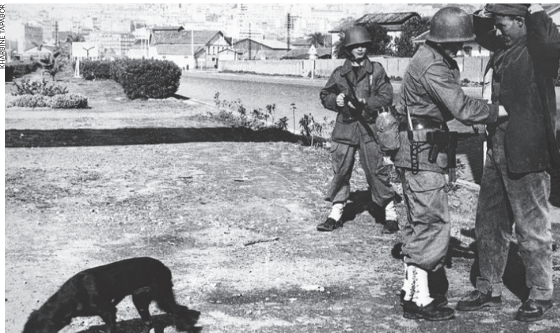
Arrestation pendant la bataille d'Alger.