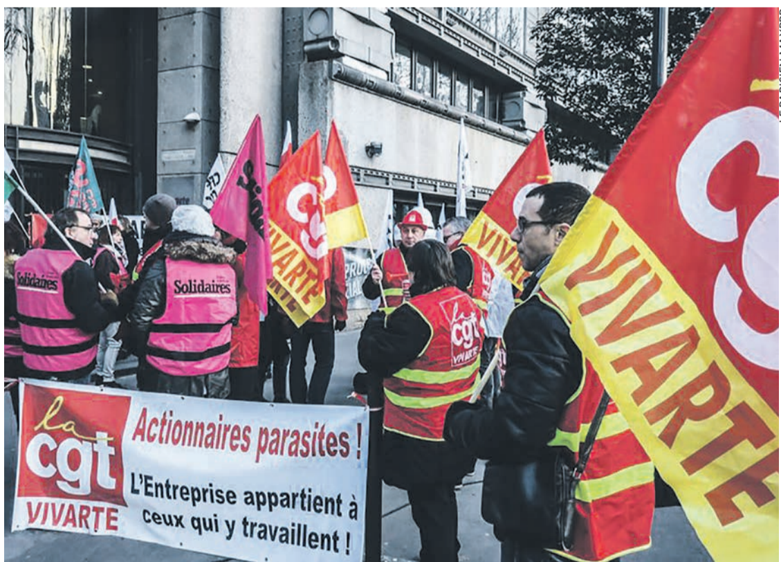
Manifestation des salariés du groupe Vivarte devant le siège parisien.

En fait, toutes ces enseignes rencontraient déjà des difficultés, car depuis 2008 la consommation augmente annuellement de