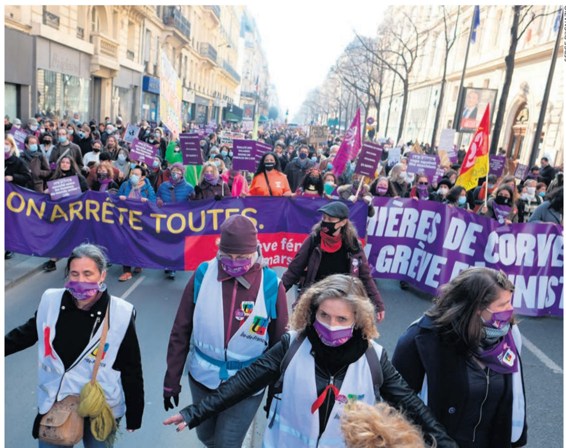
Manifestation du 8 mars 2021.

De toute façon, pour les patrons assez mauvais pour s'être attribué une note en dessous du minimum requis fixé à 75 – comme Bolloré SE ou encore ArcelorMittal Industrie par exemple –, les sanctions sont ridicules. Ils ont trois