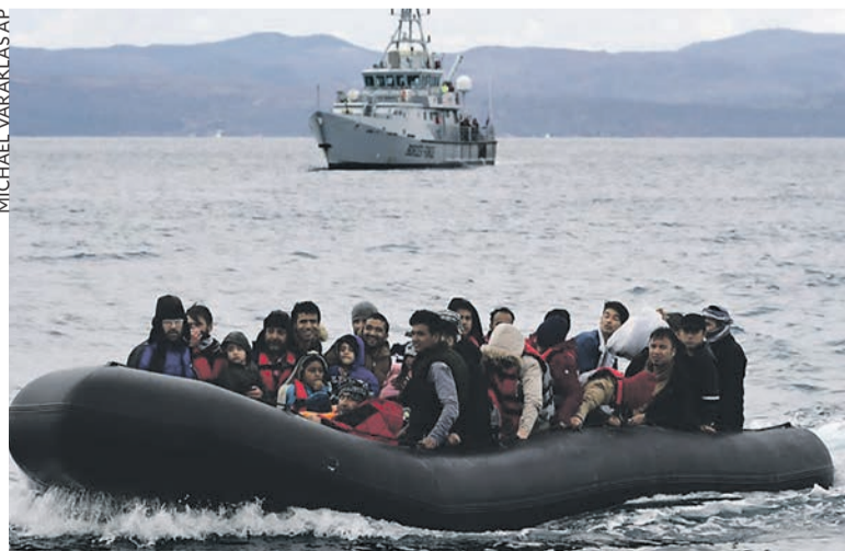
Un bateau de réfugiés en mer Égée.