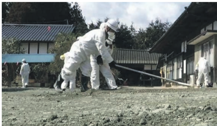
Trois ans après, les ouvriers décontamineurs.

Pour autant, les dangers et les menaces ne sont pas d'abord ceux d'une technique. La récente panne géante d'électricité au Texas avec ses conséquences dramatiques pour des millions de gens ne doit rien au nucléaire mais tout au marché privé et à la loi du profit. Tant que toute la production, le bâtiment, le transport, dans l'énergie comme dans les autres domaines, seront entre les mains de capitalistes privés mus par le profit, la menace d'être empoisonné par l'air que l'on respire ou l'eau que l'on boit subsistera.