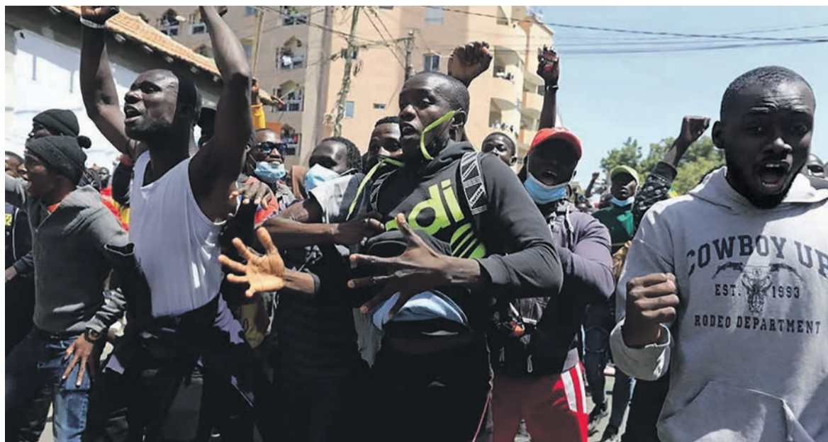
Le 8 mars, des manifestants pro Sonko à Dakar.

du viol d'une employée d'un salon de beauté. Il se rendait à la convocation du juge d'instruction entouré d'une foule de partisans lorsque la police l'a interpellé à mi-chemin d'un parcours émaillé de nombreux heurts et l'a incarcéré pour troubles à l'ordre public. La colère de la population a alors explosé, dépassant largement les rangs de ses partisans, et les manifestations ont tourné à l'émeute, non seulement dans la capitale Dakar, mais sur toute l'étendue du territoire. Les partisans de Sonko dénoncent dans son inculpation pour viol une manœuvre destinée à l'empêcher de se présenter aux prochaines élections présidentielles en 2024. L'utilisation de la justice pour arriver à ses fins politiques est tout à fait dans les habitudes de Macky Sall, qui pourrait vouloir se présenter à un troisième mandat. Mais, au-delà des manœuvres du président, l'arrestation d'Ousmane