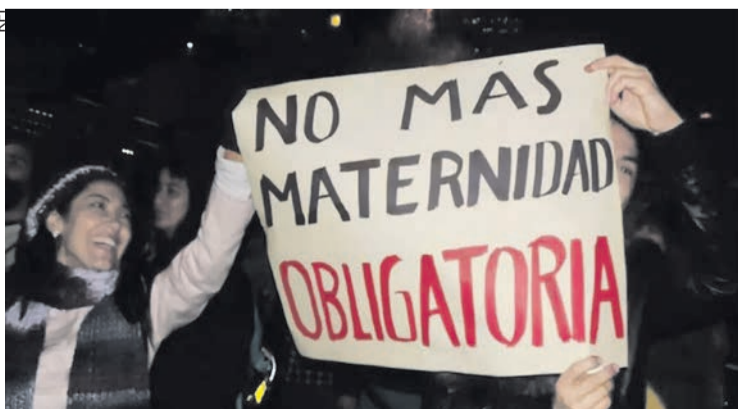
Les femmes veulent mettre fin aux grossesses imposées.