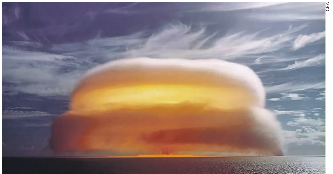
Essai nucléaire sur l'archipel des Tuamotu en 1971.

Une étude publiée en 2016 montrait déjà que les évaluations officielles de la contamination de ces populations étaient largement sous-estimées. À partir des rares données militaires disponibles, il fut évalué que lors du premier essai, le 2 juillet 1966, le niveau de radiation sur l'archipel des Gambier, à 500 km de Mururoa, fut mille fois supérieur à celui relevé en France après le passage du nuage de Tchernobyl. Disclose démontre que l'armée savait pertinemment