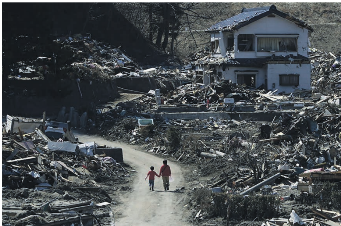
Après le tsunami.

Pour les riverains victimes de la catastrophe, l'État japonais n'a eu que mépris. Ainsi l'Université de médecine de Fukushima minimise aujourd'hui les cas de cancers de la thyroïde chez les enfants, pourtant multipliés par dix selon certaines études, et met en doute leur lien avec l'accident. Là encore, les effets décalés dans le temps des radiations et la capacité de Tepco et du gouvernement à financer des études contradictoires, jouent contre la population. Dès avril 2011, l'État a relevé de 1 à 20 millisieverts par