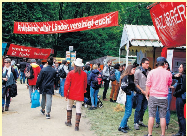
Vivement le 5 juin !

les quartiers et les entreprises où nous vivons et militons.