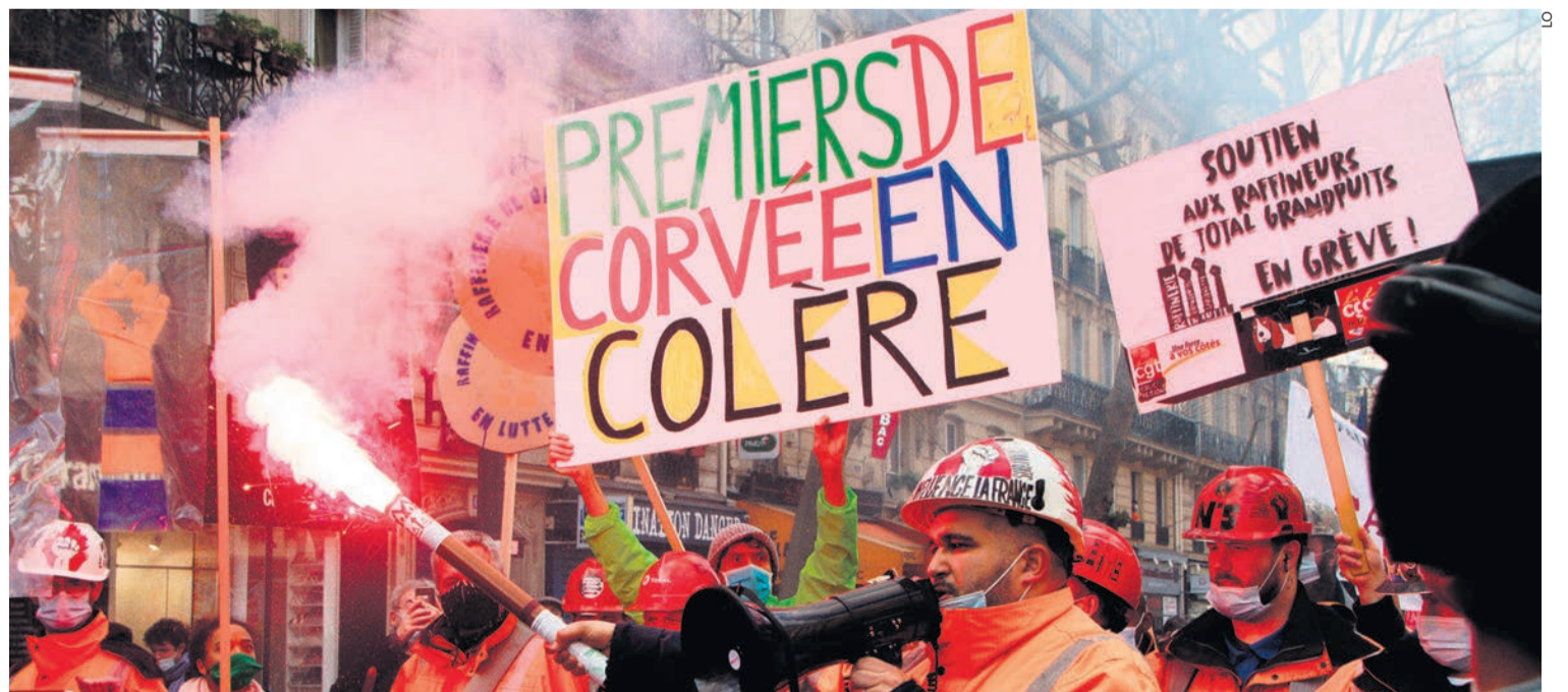
Manifestation contre la précarité, le 4 février.

En travaillant, nous ne gagnons pas seulement notre pain. Nous produisons toutes les richesses. Nous produisons les profits, les capitaux et les fortunes extraordinaires qu'une minorité s'approprie. Nous sommes à la base de toute la vie sociale. Cela nous donne non seulement la légitimité d'imposer nos intérêts contre la classe de parasites qui domine la société, mais cela nous donne aussi les moyens d'inverser le rapport de force.