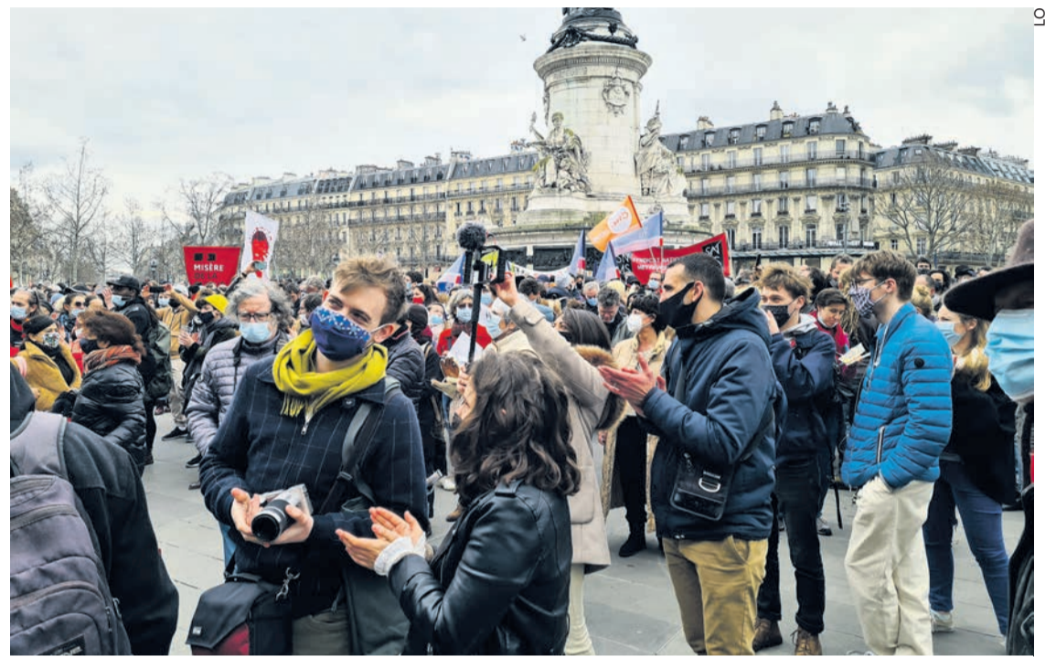
La manifestation des intermittents du 4 mars.