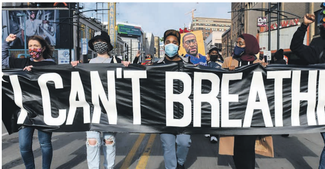
Des manifestants défilent dans les rues de Minneapolis à la veille du procès.

En même temps, il est très rare que des policiers soient condamnés pour de tels meurtres. Chaque année, un millier de personnes sont tuées par la police, des Noirs en proportion 2,5 fois supérieure à leur nombre dans la population. Ces dernières années, après des meurtres de sang-froid d'hommes