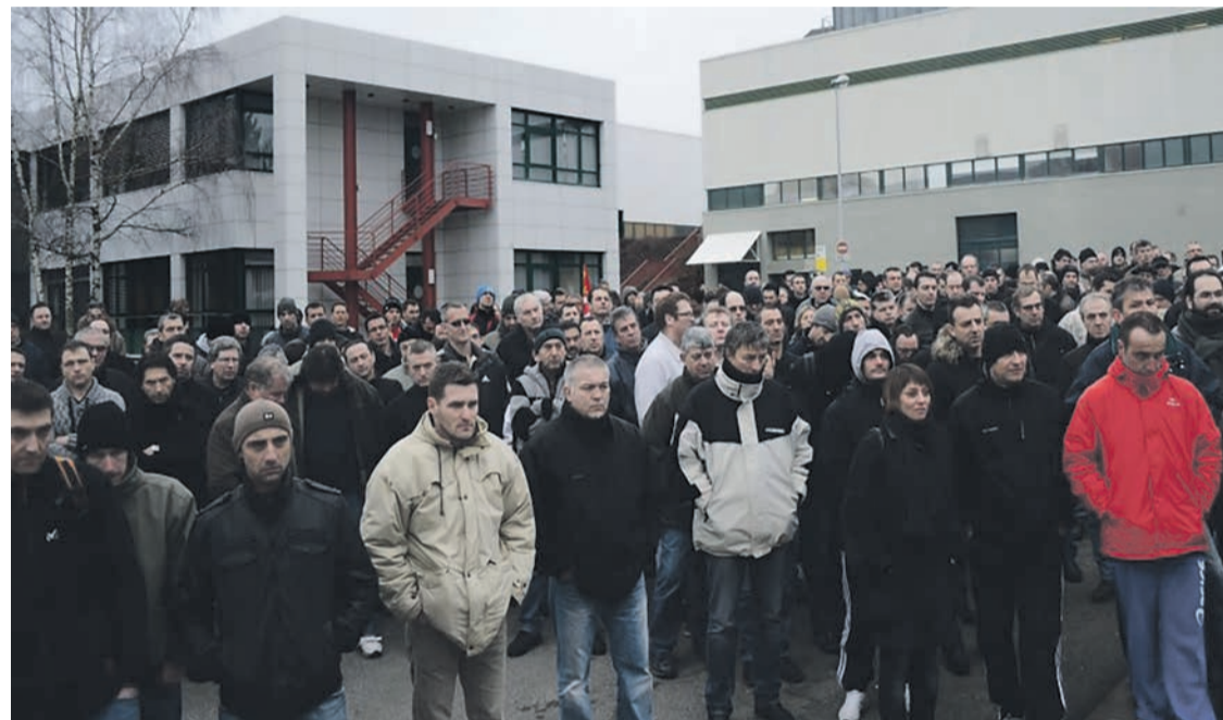
Rassemblement des travailleurs de Bosch-Onet, le 14 février.

Aujourd'hui, Bosch annonce donc que, en 2025, il