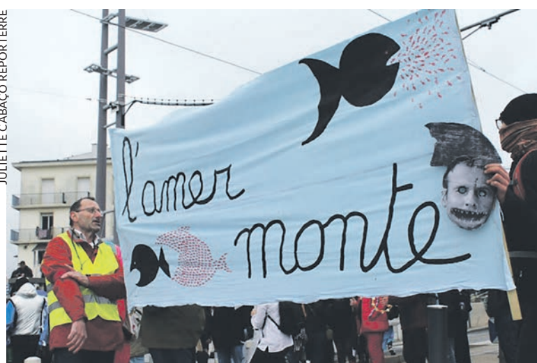
Manifestation pendant le sommet de Brest.

Réunis à Brest du 9 au 11 février sous la houlette de Macron lui-même, des chefs d'État, des professionnels de la mer et des représentants d'organismes internationaux et d'ONG ont devisé de la situation et de l'avenir de l'océan.