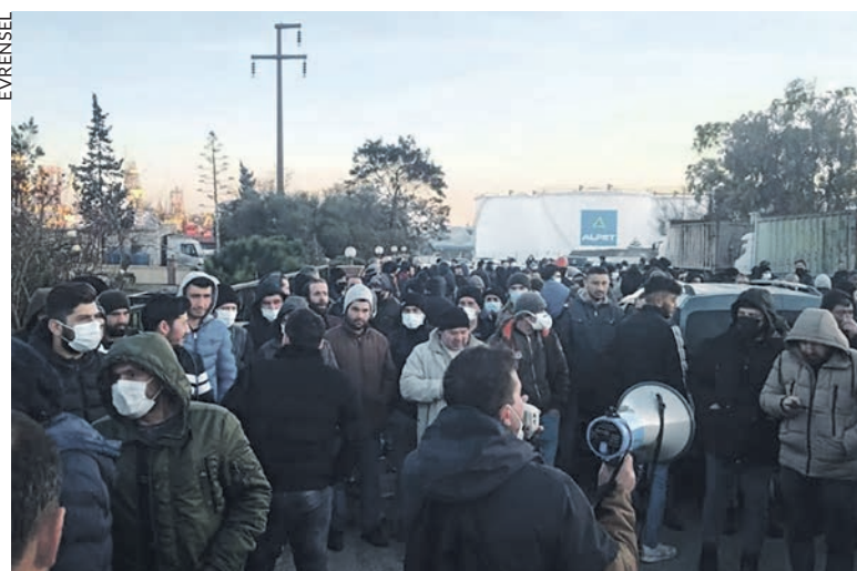
En février, lors d'une grève à Izmir Aliaga.