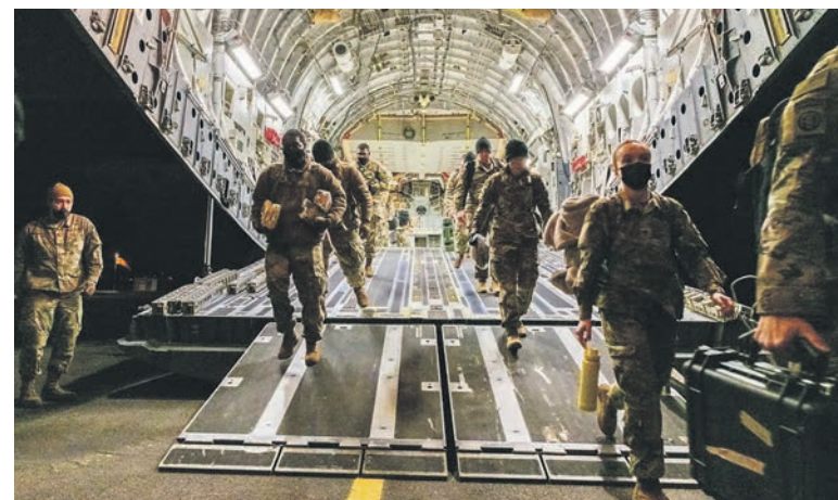
Des soldats américains arrivent à Wiesbaden, QG de l'OTAN en Allemagne.

Depuis près de trois mois, l'administration de Washington se livre à une vaste manipulation de l'information, comme à chaque fois qu'il lui faut justifier une intervention quelque part dans le monde. Avec cette opération, Biden veut certainement se donner une nouvelle stature vis-à-vis de son opinion publique alors que, depuis l'évacuation