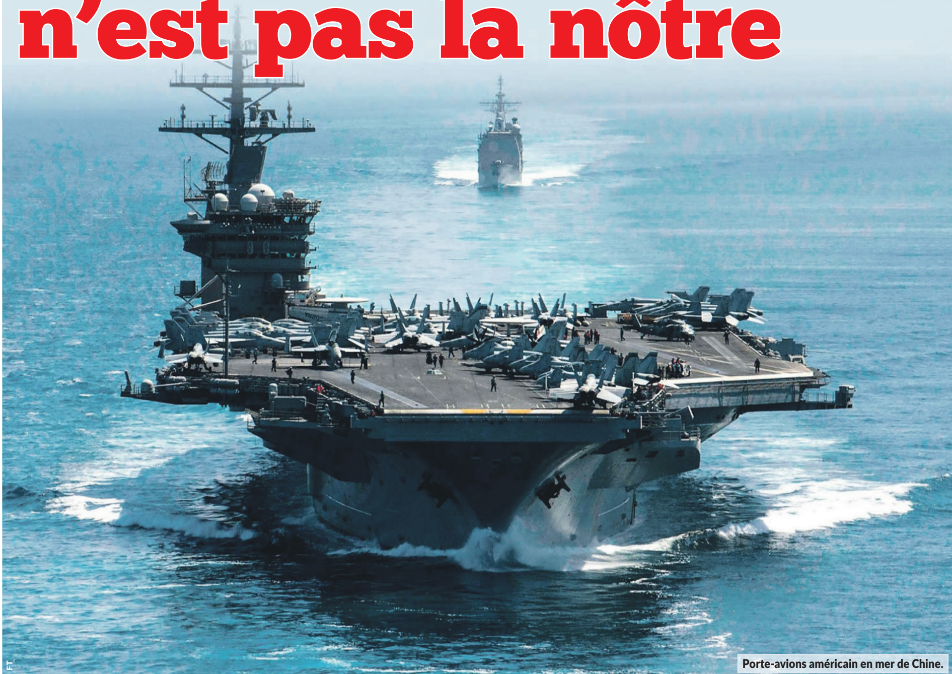
Porte-avions américain en mer de Chine.