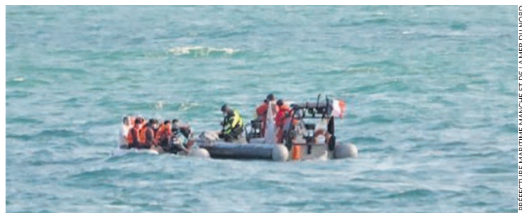
PRÉFECTURE MARITIME MANCHE ET DE LA MER DU NORD

Le Cross (Comité régional opérationnel de surveillance et de sauvetage) vient de fournir à la justice 5000 enregistrements téléphoniques recueillis dans la nuit du 23 au 24 novembre 2021 lorsque 27 migrants se sont noyés dans la Manche.