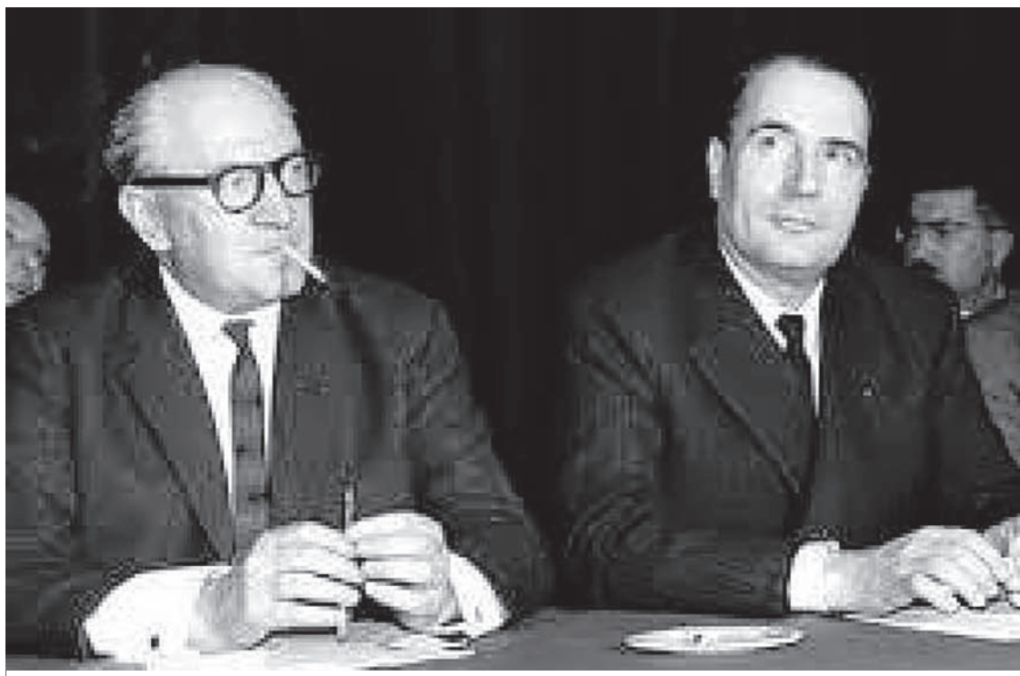
Le socialiste Mollet et son ministre Mitterrand en mars 1956.

La SFIO, ancêtre du PS, fut portée au pouvoir en 1956. Guy Mollet, soutenu par le Parti communiste,