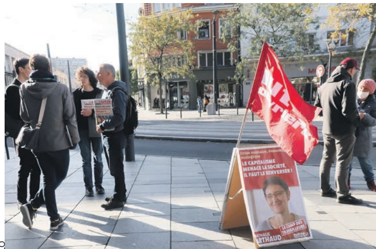
En campagne à Valenciennes.

Lutte ouvrière et Nathalie Arthaud n'ont pas fait la loi concernant les parrainages. La règle des 100 puis 500 parrainages nécessaires a été adoptée en principe