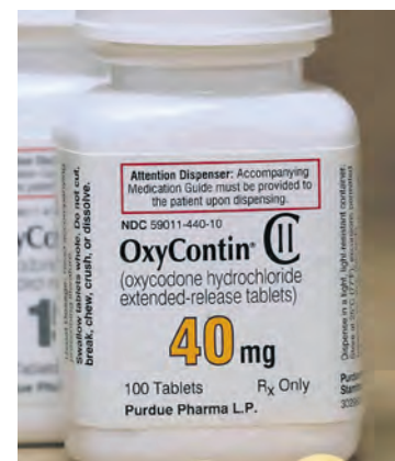
COERGE FRY REUTERS