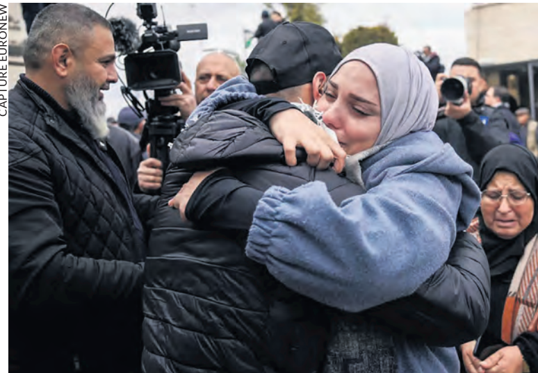
L'accueil de prisonniers palestiniens libérés le 8 février.