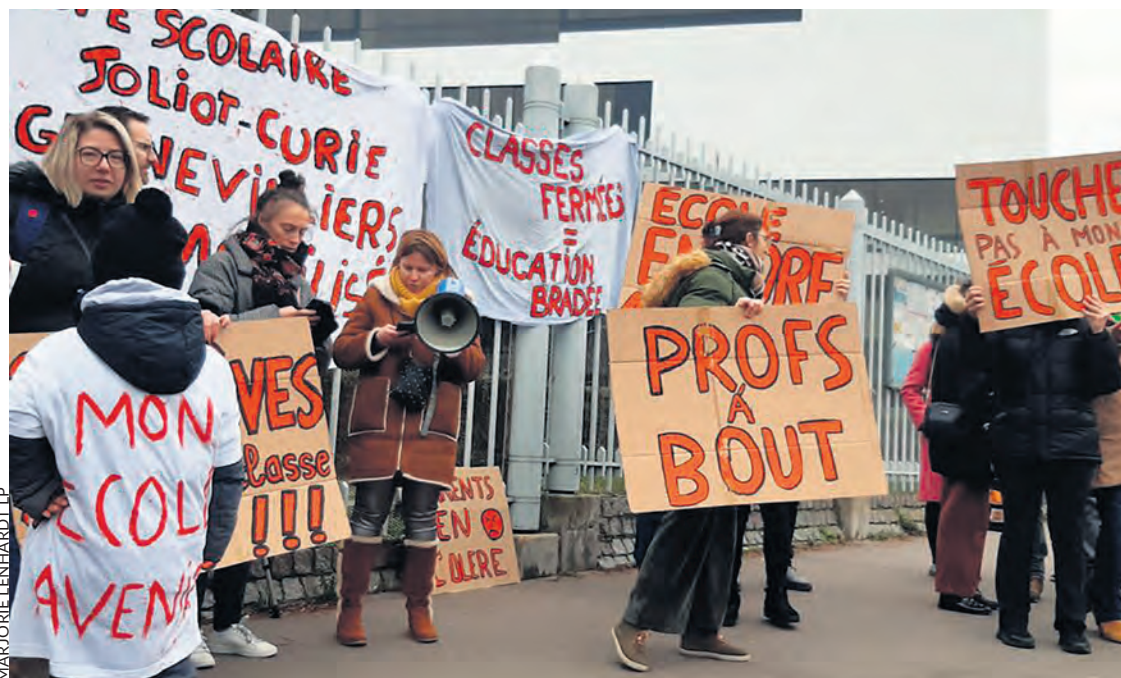
À Nanterre le 11 février.

Cette manière de déshabiller le petit Pierre pour ne même pas habiller le petit Paul est inacceptable. Partout les enseignants constatent qu'ils ne sont pas assez nombreux pour pouvoir travailler en petits groupes et avoir le temps de consacrer l'attention nécessaire à chaque élève en difficulté. Partout les parents affirment qu'il faudrait des remplaçants en nombre suffisant pour que les professeurs absents puissent être remplacés et que les enfants ne perdent pas de nombreux