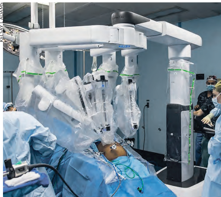
Un robot chirurgical sur un navire hospital américain.