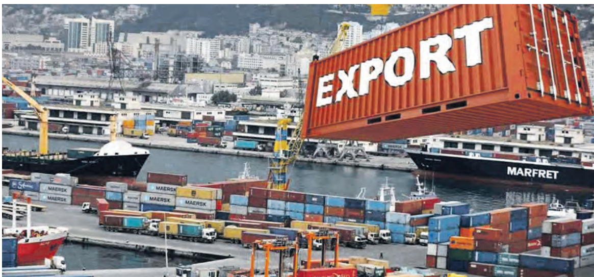
Dans le port d'Alger.