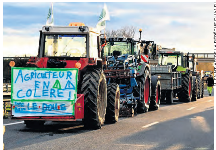
Le 18 janvier, sur l'autoroute A64.