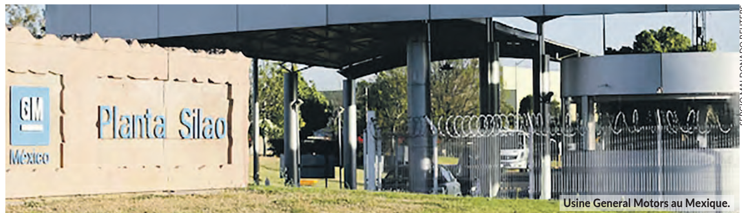
Usine General Motors au Mexique.