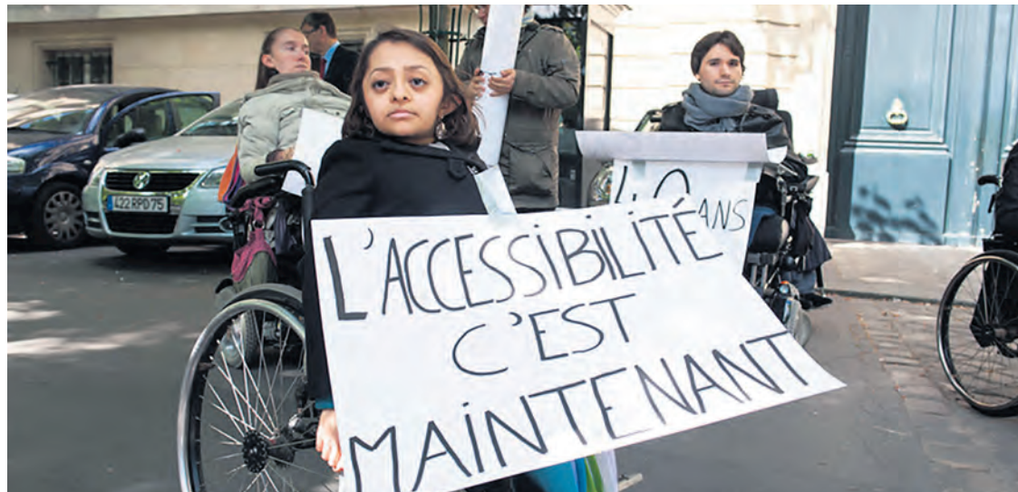
Une militante du Collectif de lutte des handicapés en... 2014.