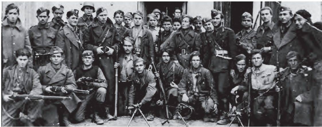
Combattants de l'ELAS, à l'été 1944, en Grèce continentale.

En 1943, après la déroute allemande devant Stalingrad et la défaite prévisible du régime hitlérien, le problème du partage du pouvoir dans l'Europe d'après-guerre était posé. Le souci des Alliés était d'éviter qu'une nouvelle vague révolutionnaire ne se déclenche, comme après la Première Guerre mondiale, mais aussi de se partager les zones d'influence. Le 9 octobre 1944 à Moscou, Churchill obtint de Staline un partage d'influence sur les Balkans, laissant la Grèce à la Grande-Bretagne, la Roumanie à Staline, et partageant la Yougoslavie entre les deux.