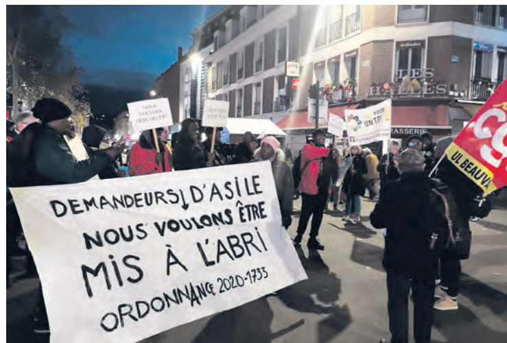
À Beauvais, en décembre.