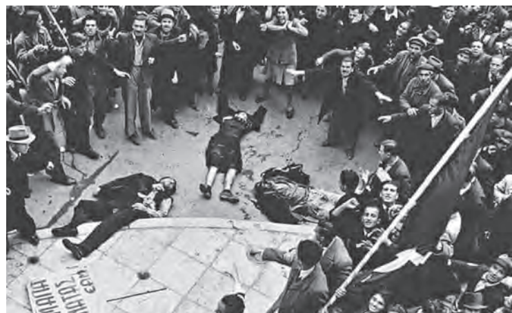
Vingt-huit manifestants furent abattus lors du soulèvement du 4 décembre 1944, à Athènes.

Pour Churchill et les dirigeants britanniques, il n'était pas question de céder un pouce de leur influence dans cette région. La Grèce, sa monarchie et ses gouvernements étaient depuis longtemps leur point d'appui vers le Moyen-Orient et le canal de Suez.