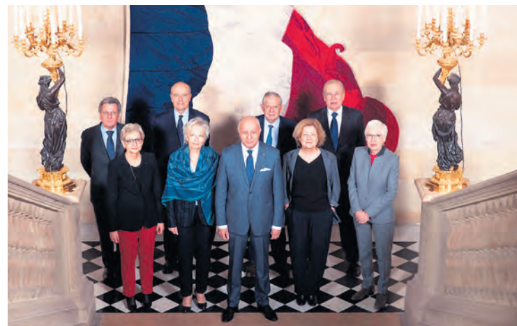
Les membres du Conseil constitutionnel.

Ce Conseil, comme toute la Constitution de 1958 qu'il est censé défendre, est, sous ses dehors d'impartialité juridique, à l'image de l'indépendance de l'État par rapport à la population et même par rapport aux élus, pourtant triés sur le volet, qui parviennent au Parlement. Il peut défaire les lois