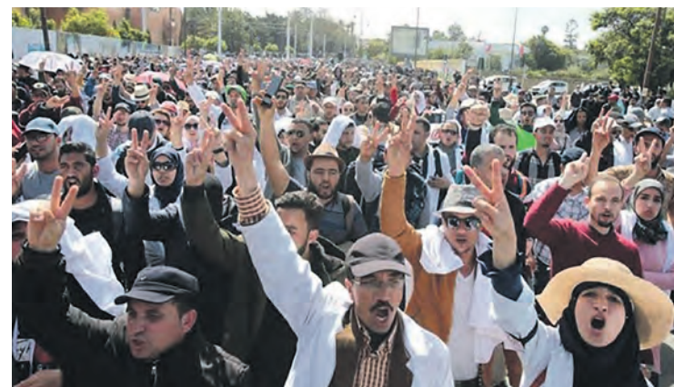
Enseignants en grève.

Au Maroc, les 5 et 6 février, les principaux syndicats du pays appelaient à la grève générale contre une nouvelle loi qui s'attaque au droit de grève.