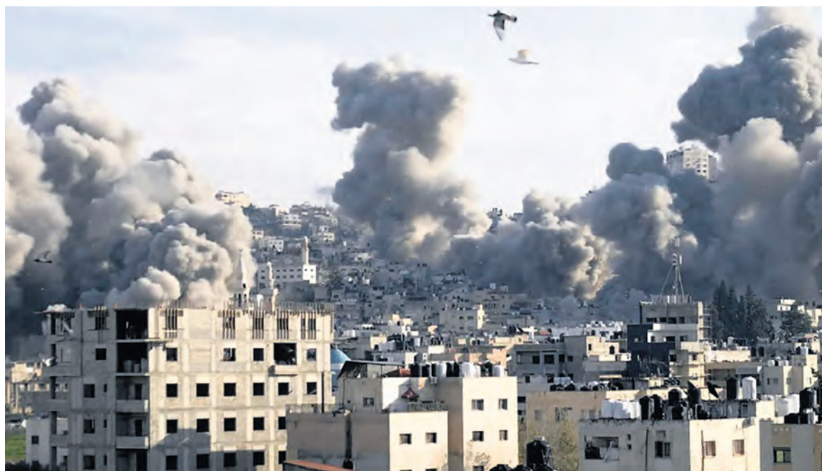
Bombardement sur le camp de Jénine, le 2 février.

l'acheminement de caravanes susceptibles d'accueillir des Palestiniens privés de toit, contrevenant ainsi à ce qui était prévu par le volet humanitaire de l'accord de cessez-le-feu. En représailles, le Hamas a menacé lundi 10 février de suspendre la libération des otages. Trump, lui, a promis « l'enfer » sur Gaza si les otages ne sont pas libérés. Fort de son appui, le gouvernement israélien peut, à tout moment, décider de reprendre les bombardements. Et, même pendant la trêve, l'armée israélienne continue de faire des victimes : selon la défense civile de Gaza, trois Palestiniens ont été abattus pour s'être « trop rapprochés » des positions israéliennes.