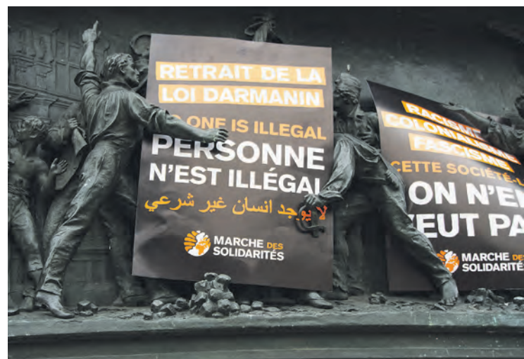
Lors d'une manifestation contre la loi Darmanin, en janvier 2024.

Mais que signifie « être Français » aujourd'hui ? Discuter de cela en termes d'« identité » n'a aucun sens. Un patron et en particulier un grand patron, tel Bernard Arnault, n'a même pas besoin de prouver qu'il est bien français pour recevoir des subventions de l'État en plus des compliments d'un Bardella. Il a même le droit de s'exprimer dans les médias pour se plaindre de payer trop d'impôts dans le pays. Mais, en revanche, pour nombre de