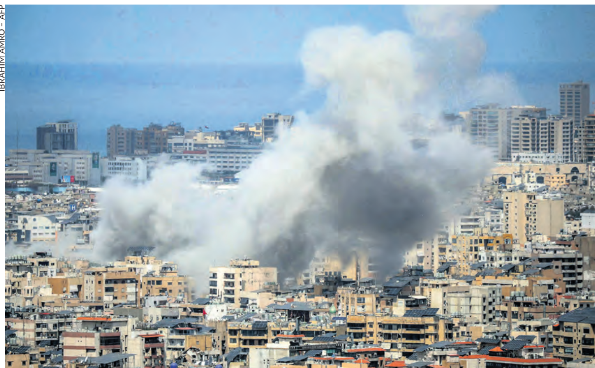
Bombardement israélien sur la banlieue sud de Beyrouth le 6 avril 2026.