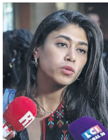
GEOFFROY VAN DER HASSELT

Alors que les défenseurs du génocide à Gaza et des bombardements des populations au Moyen-Orient