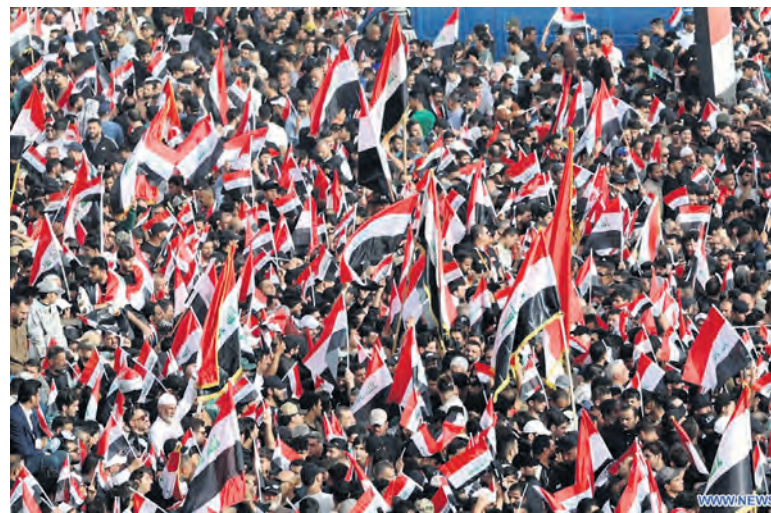
XINHUA - KHAILI

de ces groupes armés. Mais ceux-ci prospèrent depuis la guerre déclenchée par les États-Unis en 2003 et la chute de Saddam Hussein. Certains ont été intégrés dans les forces armées gouvernementales au cours de la lutte contre l'organisation État islamique, mais les autorités irakiennes ne les contrôlent pas plus que les autres. Par ailleurs, l'Irak, deuxième exportateur de pétrole après l'Arabie saoudite, subit les conséquences de la guerre menée par les États-Unis et Israël, en particulier des restrictions de navigation dans le détroit d'Ormuz. Cette situation pousse certains partis chiites influents au sein de l'État à prôner la neutralité, ce que bon nombre de groupes armés pro-iraniens refusent.