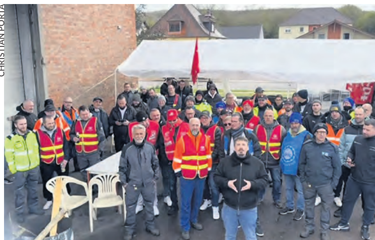
Les grévistes de la Fonderie.