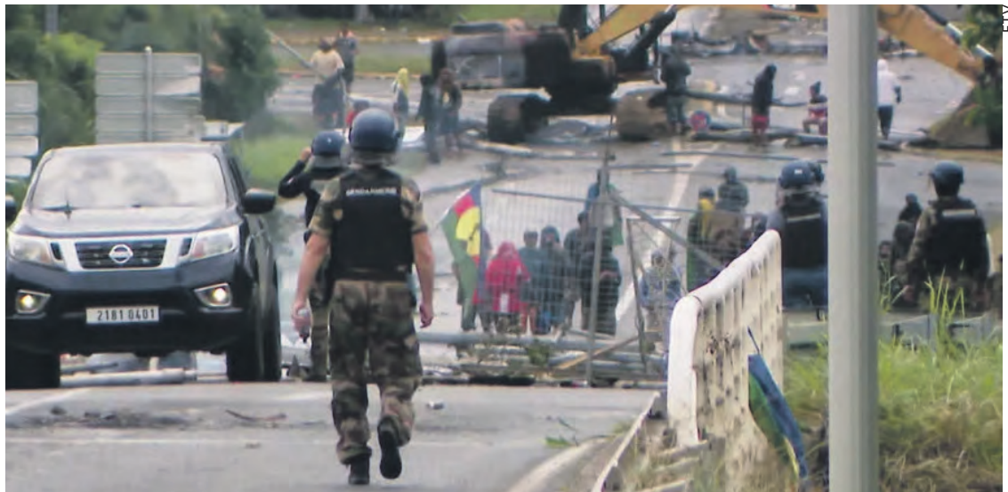
Affrontements à Nouméa en 2024.

était la réponse de l'État français aux émeutes qu'il a lui-même déclenchées en annonçant en mai 2024 l'élargissement du corps électoral au détriment des Kanaks, les rendant minoritaires dans leur propre pays. Cet accord prétendait donner des gages aux Kanaks en instaurant un « État de Nouvelle-Calédonie » au sein de l'État français qui aurait ainsi conservé la main sur l'armée, la police, la jus-