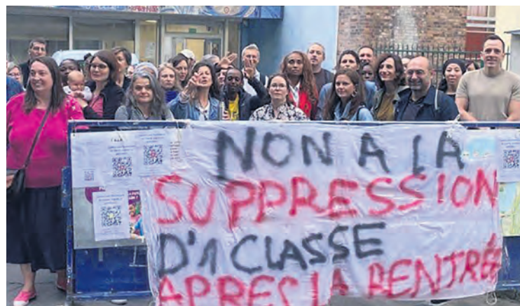
À l'école Henri-Wallon à Pantin, en Seine-Saint-Denis.