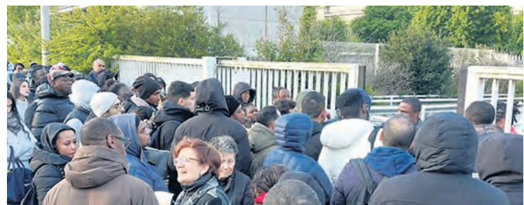
File d'attente devant la préfecture d'Evry-Courcouronnes.

Des centaines de milliers de travailleurs étrangers voient donc arriver la date d'expiration de leur titre de séjour d'un, quatre ou même dix ans avec l'angoisse de ne pas arriver à le faire renouveler à temps et de perdre leur emploi. C'est une menace qui pèse sur toute une fraction du monde du travail, et qui se concrétise avec de plus en plus de contrats suspendus voire de licenciements, sous ce prétexte.