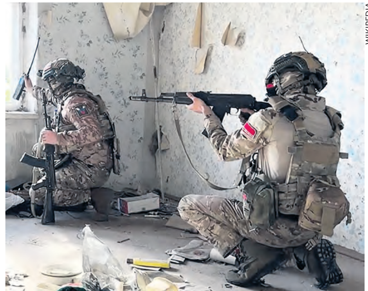
Soldats russes en action.

Les finances publiques en berne, avec pour conséquence une réduction