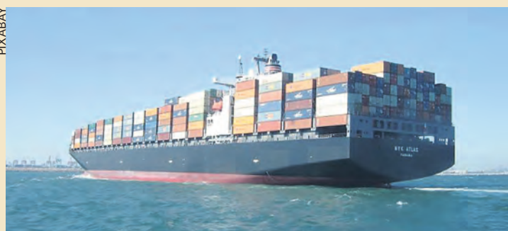
Un bâtiment de l'armement grec.