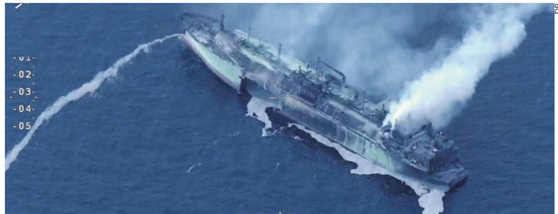
L'Arctic Metagaz en feu et à la dérive.

L'Arctic Metagaz faisait route depuis Mourmansk, port russe de la mer de Barents, probablement à destination de la Chine via le canal de Suez lorsque, le 3 mars, une explosion suivie d'un incendie a obligé l'équipage à abandonner le navire sur des canots de sauvetage.