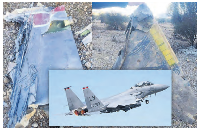
Les débris d'un avion F-15 abattu par l'armée iranienne.

Des négociations ont en fait eu lieu pendant que Trump s'agitait, le Pakistan servant d'intermédiaire. Rien ne dit que le