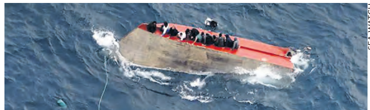
Embarcation ayant chaviré le 5 avril.