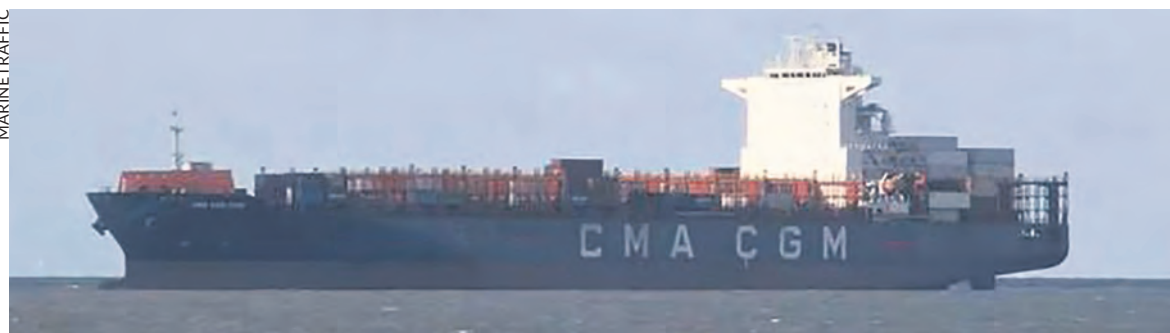
Dans le détroit d'Ormuz le 2 avril.