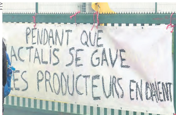
Manifestation le 19 février 2026 devant l'usine Lactalis de Mautauban.