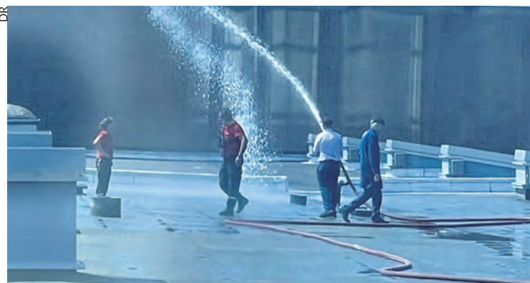
Arrosage des toits.

Dans cette usine, durant la journée de travail de 7 heures, il n'y a habituellement que deux pauses de 20 minutes. C'est déjà intenable en général, ne serait-ce que pour manger. Mais avec la canicule, cela devenait insupportable.