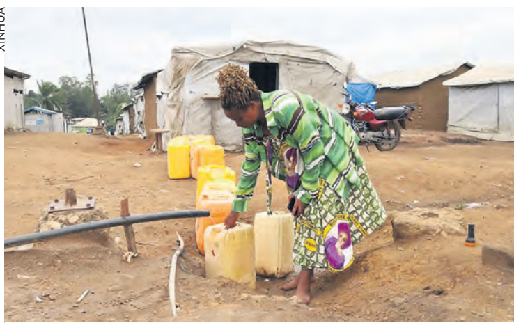
Camp de déplacés de Kigonze en RDC.

Depuis la mi-mai, une épidémie due au virus Ebola frappe la République démocratique du Congo et l'Ouganda. En RDC, le bilan officiel atteignait, au 23 juin, 1 048 cas confirmés et 267 morts. En Ouganda, une vingtaine de cas ont été recensés.