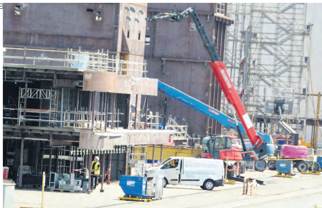
Assemblage sur l'aire de prémontage des blocs sortis des ateliers.