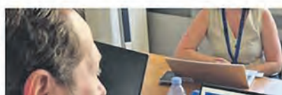
CAPTURE LE COURRIER PICARD

14,3 millions d'euros de fraudes à la Sécurité sociale auraient été détectées dans l'Oise, selon un gros titre du quotidien Le Courrier picard du mardi 16 juin.