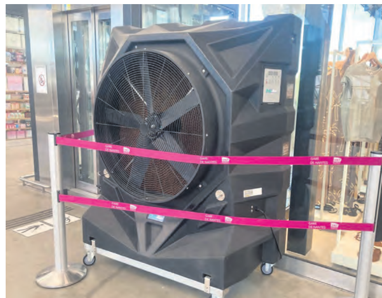
Ventilateur en gare de Nantes.

présents ont démontré qu'ils sont, eux, responsables et que, quand ils discutent entre eux, ils savent parfaitement faire tourner la gare tout en protégeant leur santé et celle des