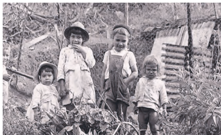
Enfants de La Réunion dans les années 1960.

La loi qui vient d’être votée ne réparera jamais le préjudice, pas plus que la