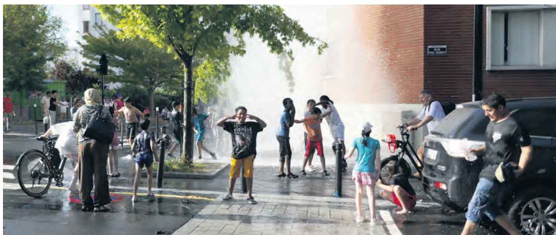
À Aubervilliers, le 23 juin.

Dans tous les domaines, le gouvernement adopte des solutions d'urgence qui ne lui coûtent rien : annulation d'examens, fermetures d'écoles... « Si vous êtes dans un bâtiment qui ne dispose d'aucun espace rafraîchi [...], vous fermez l'école pour la journée ou la demi-journée », a déclaré le ministre de l'Éducation nationale Édouard Geffray le 17 juin, à la veille de l'épisode de chaleur. Cela en dit long sur sa façon de considérer celles et ceux qui connaissent la surchauffe