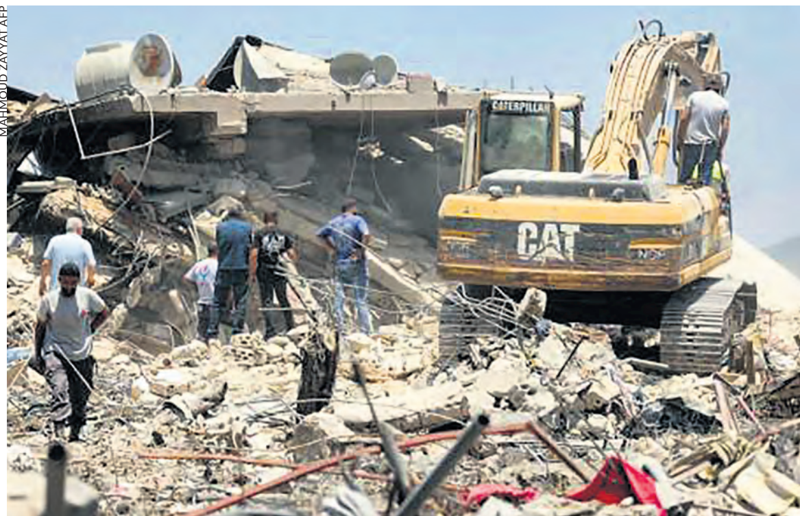
Nabatieh le 21 juin, après un bombardement.