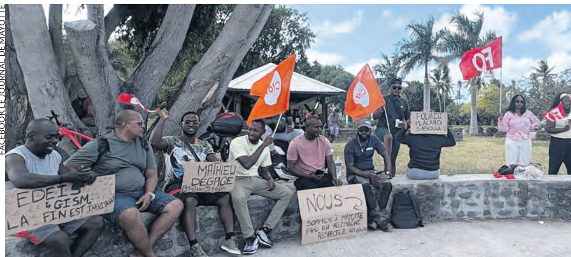
Les grévistes à l'aéroport.