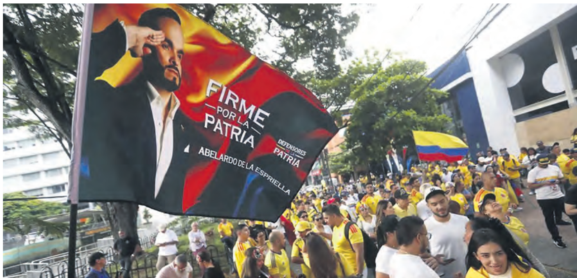
Des partisans du candidat d'extrême droite de La Espriella (au garde-à-vous sur le drapeau).

L'extrême droite a pu bénéficier du fait que cette politique semble avoir échoué complètement, et en effet la pauvreté ne recule pas. Des enfants continuent de mourir de malnutrition dans