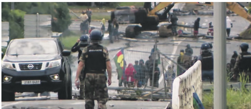
Manifestation à Nouméa en 2024

Signé en juillet dernier par tous les partis sauf le FLNKS, l'accord dit de Bougival était la réponse de l'État français aux émeutes qu'il a lui-même déclenchées en annonçant en mai 2024 l'élargissement du corps électoral au détriment des Kanaks, les rendant minoritaires dans leur propre pays. Cet accord prétendait donner des gages aux Kanaks en instaurant un « État de Nouvelle-Calédonie » au sein de l'État français qui aurait ainsi conservé la main sur l'armée, la police, la justice, ces fonctions ne pouvant être transférées localement que par un vote des trois cinquièmes du Congrès calédonien. Ce transfert aurait été d'autant plus impossible que l'élargissement du corps électoral, contre lequel s'est insurgée la