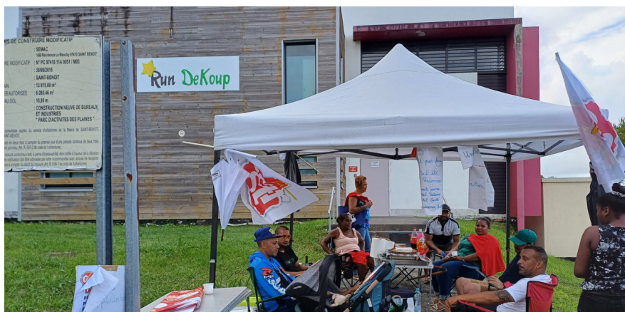
Les travailleurs de Rundekoup (Terracoop) en grève en février 2024

Ce groupe, dont dépendent tous les éleveurs de l'île, emploie directement et indirectement plus de 300